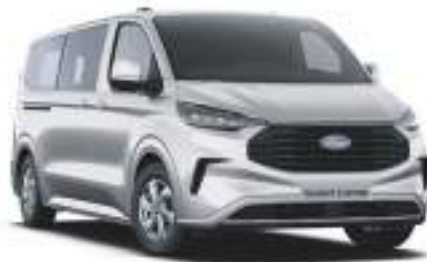
MOONDUST SILVER - LAKIER METALIZOWANY 2 750 zł