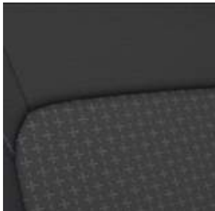
Ford Transit Custom Kombi L1 w wersji Trend z manualną skrzynią biegów i tapicerką materiałową - ciemną (standard)