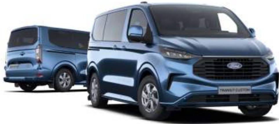
Ford Transit Custom Kombi L1 w wersji Limited Kolor nadwozia Chrome Blue (opcja)