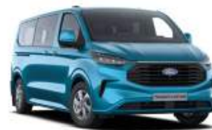
DIGITAL AQUA BLUE - LAKIER ZWYKŁY 2 750 zł Dla wersji TREND dostępny tylko z napędem elektrycznym