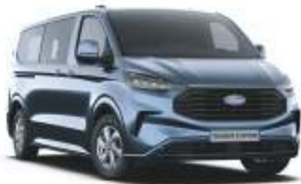
CHROME BLUE - LAKIER METALIZOWANY 2 750 zł