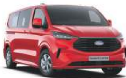
RACE RED - LAKIER ZWYKŁY bez dopłaty - lakier dostępny tylko dla wersji TREND