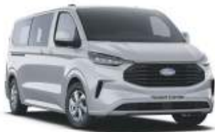
GREY MATTER - LAKIER ZWYKŁY SPECIALNY 2 750 zł - lakier niedostępny dla wersji TREND