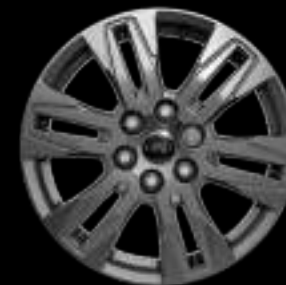
17-calowe obrycze kół ze stopów lekkich ogumienie 215/60 R17