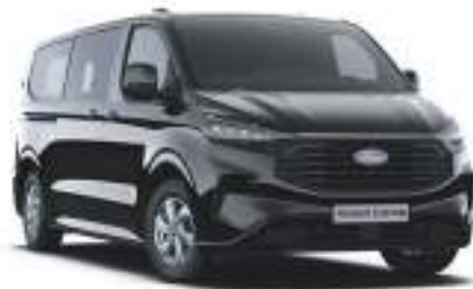
AGATE BLACK - LAKIER METALIZOWANY 2 750 zł