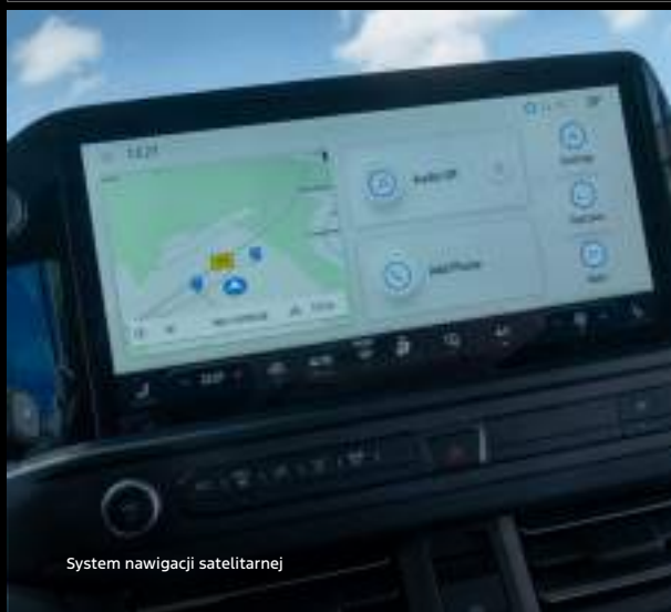
System nawigacji satelitarnej