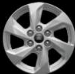
16-calowe obrycze kół ze stopów lekkich ogumienie 215/65 R16