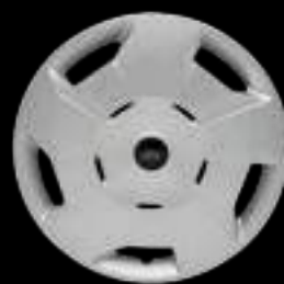
16-calowe stalowe obrycze kół z kotłakami ogumienie 215/65 R16