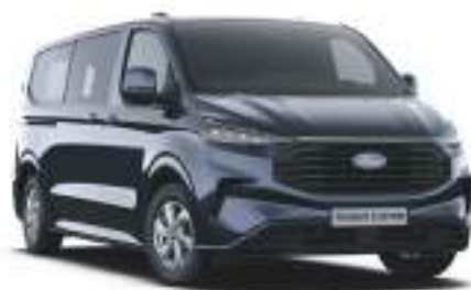
BLAZER BLUE - LAKIER ZWYKŁY bez dopłaty - lakier dostępny tylko dla wersji TREND