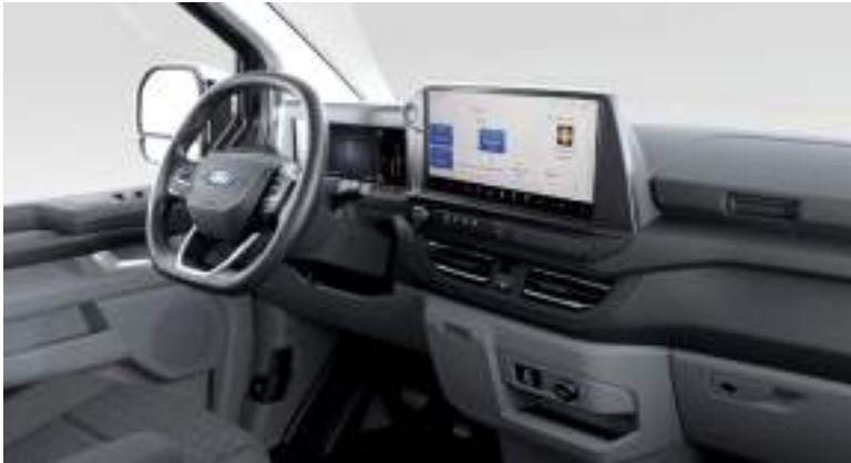
Ford Transit Custom Kombi L1 w wersji Limited z automatyczną skrzynią biegów i tapicerką materiałową - ciemną (standard)