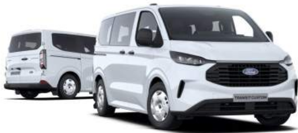
Ford Transit Custom Kombi L1 w wersji Trend Kolor nadwozia Frozen White (bez dopłaty)