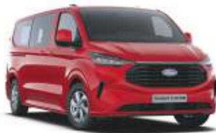
ARTISAN RED - LAKIER METALIZOWANY 2 750 zł - lakier niedostępny dla wersji TREND