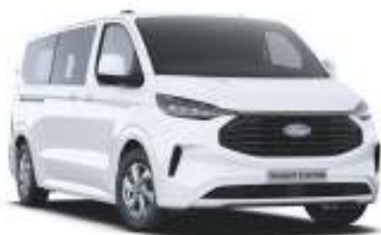
FROZEN WHITE - LAKIER ZWYKŁY bez dopłaty