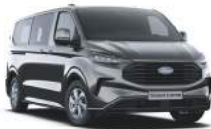
MAGNETIC GREY - LAKIER METALIZOWANY 2 750 zł